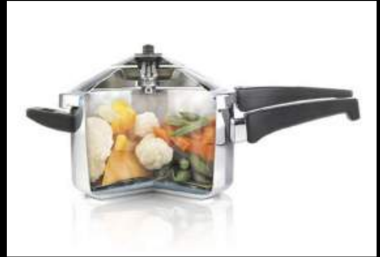
CONTAR CON INGREDIENTES