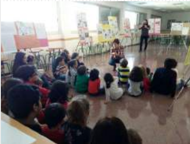
El objeto más valioso de mi abuela