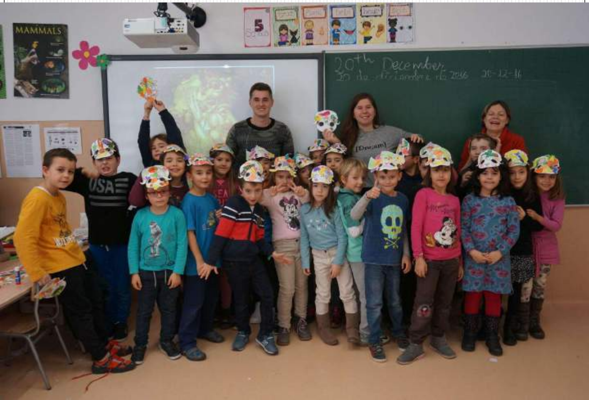
Talleres con mucho Arte