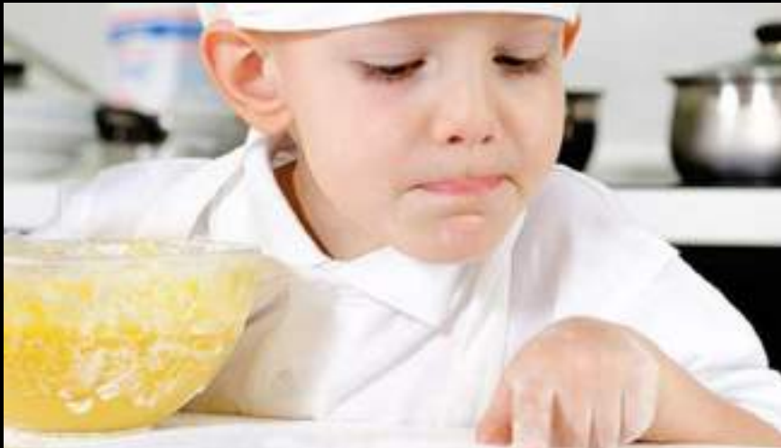
DESARROLLO DEL GRUPO DE TRABAJO