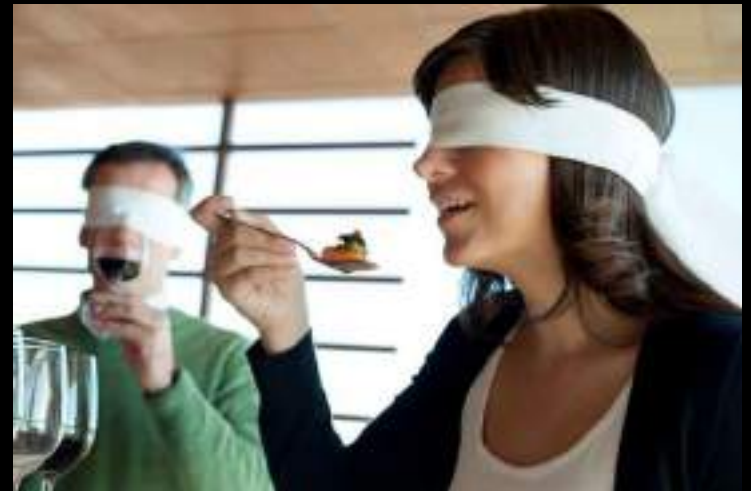
FASE DE REFLEXIÓN