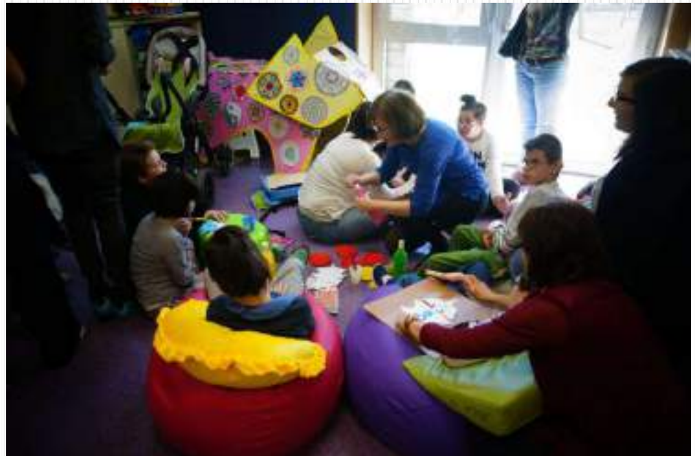
La elefanta Shiva