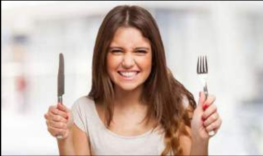
DETECTAR UNA NECESIDAD